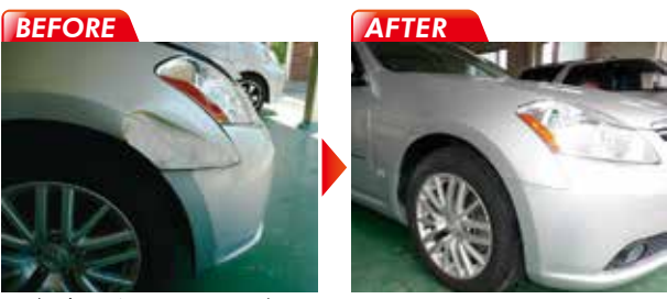
モデル車両 / NISSAN フェーガ

保証 当社の修理はすべて保証付きです。修理後は安心してご乗車できます。万一のクレームにも迅速に対応致します。